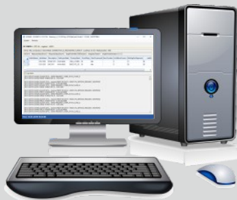
Leitstelle mit z. B. Softwaregateway IEC8080